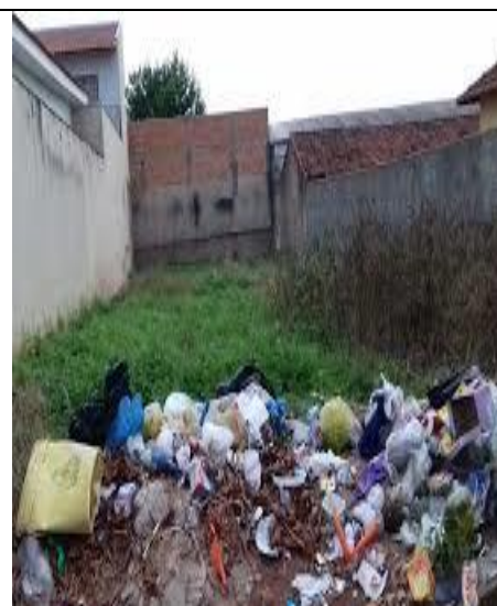
LIXO JOGADO DE FORMA INADEQUADA EM TERRENOS VAZIOS