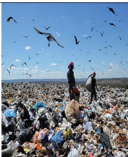
LIXÃO A CÉU ABERTO